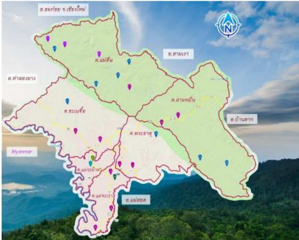
ภาพที่ ๑ แผนที่อำเภอแม่ระมาด จังหวัดตาก